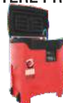
AQOA CLEAN Delphi - 100L