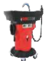
AQOA CLEAN Hippo - 40L